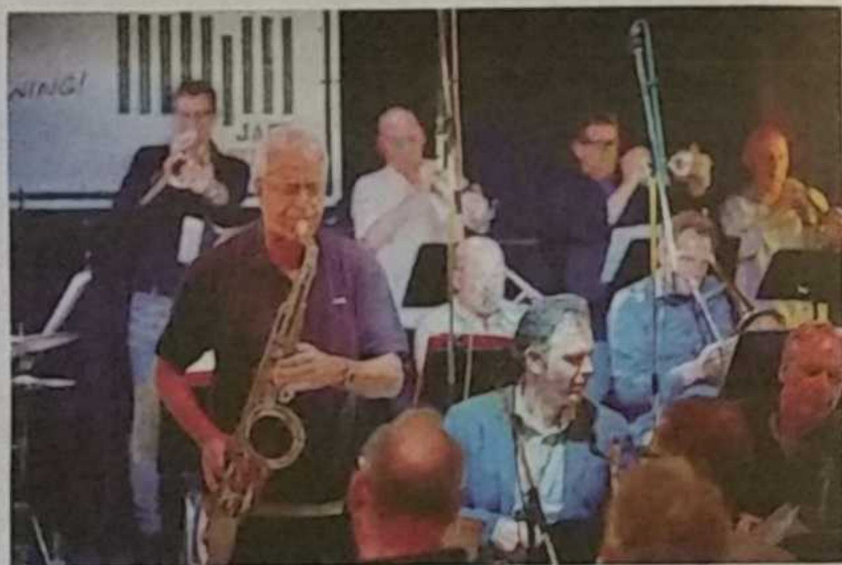
• Een optreden van Timeless tijdens een eerdere editie van Beeren Jazz Society.

Als saxofonist bij het gerenommeerde Metropole Orkest, dat zowel jazz als pop speelt, kon Beeren daarvoor zijn uitgebreide netwerk inzetten. Om de concerten